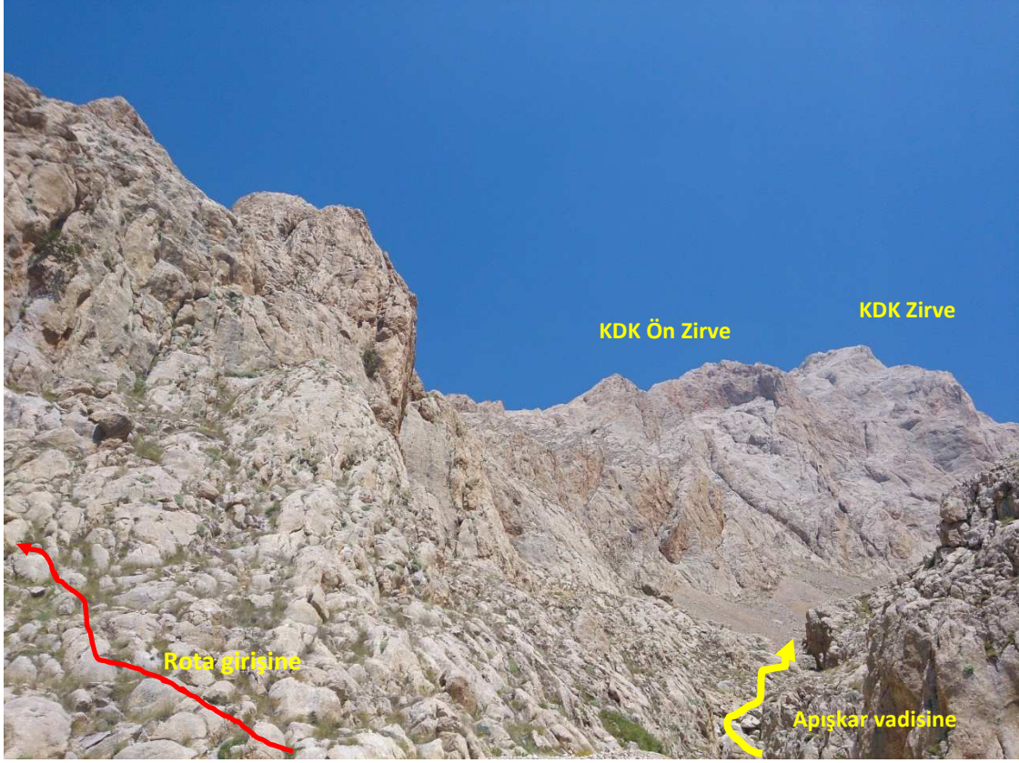
Apışkar vadisi ile rota girişı kesişiminden görünüm

Rota Kuzey ve Güney yüzleri arasında daralarak yükseliyor. Yükselirken birbirine paralel yukarı doğru uzanan külahlar boyunca devam ediliyor. Külahlar bazı noktalarda derinleşiyor ve yan geçişler gerektirebiliyor olsa da ip açmayı gerektirecek bir durum ortaya çıkmadan sizi doğrudan zirve kulesine götürececek olan sırt-kılçık hattının öncesindeki ön zirve kulesine ulaştırıyor. Yükseklik kazanırken, zirve yönüne sağa doğru kayınca görülebilen güney yüzü, sola doğru kayınca da kuzey yüzü sizi ön zirveye yaklaştığınızı anlayabilirsiniz. Ön zirve kulesine yaklaşık 3 saatte ulaştık.